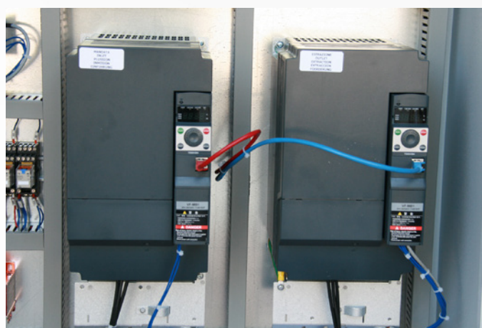
Inverseurs pour réglage débit flux d'air. Inverter para regulación del caudal.