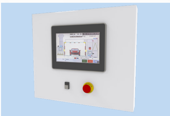
Tableau de commande avec écran tactile 9.2 pouces en couleur et processeur PLC. Cuadro de control con display táctil de 9,2 pulgadas a color y procesador PLC.